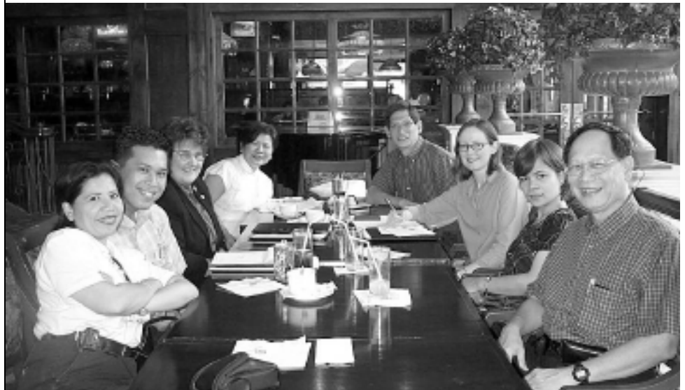
Los socios de hermanamiento Australia – Filipinas se reúnen para evaluar avances y establecer nuevas metas y objetivos.

La sociedad implica trabajar junto con su organización hermana en un proyecto o actividad. Una comunicación eficaz que supere barreras culturales y del idioma es el puente que permitirá a las sociedades de hermanamiento alcanzar el éxito.