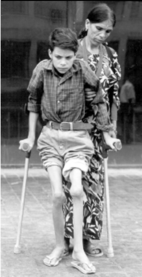
Un niño con hemofilia en Nepal.

La hemofilia afecta a cerca de 400 mil personas en todo el mundo. 75 por ciento de ellas reciben poco o nulo tratamiento. Con productos de tratamiento y cuidados adecuados, las personas con hemofilia pueden llevar una vida completamente saludable. Si no es tratada, la hemofilia produce dolores paralizantes, daños severos a las articulaciones, discapacidad y muerte.