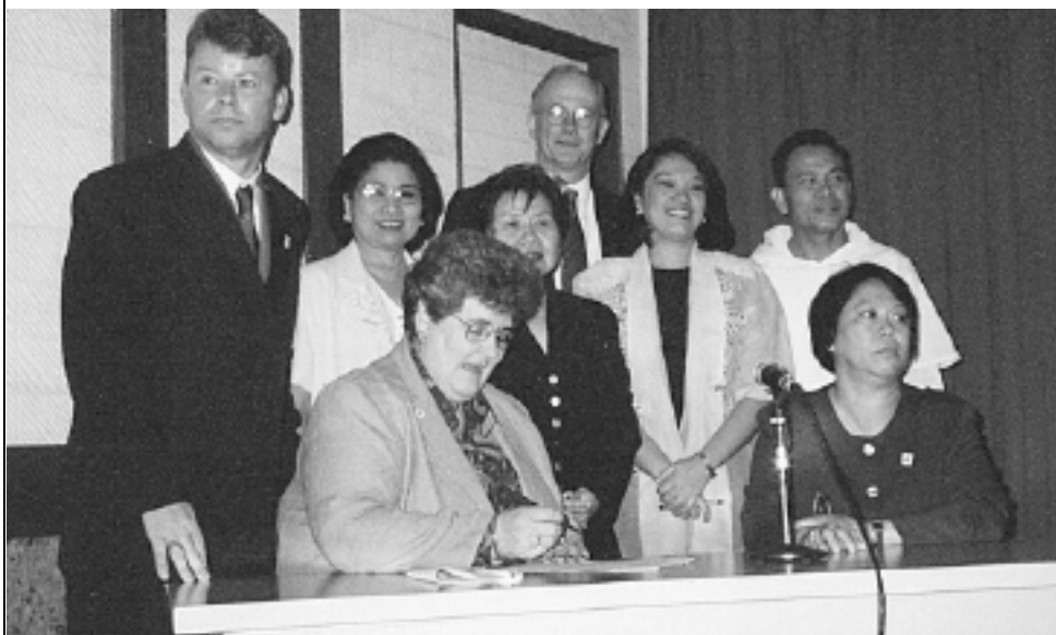
Lanzamiento oficial de la sociedad de hermanamiento entre la Asociación de Hemofilia de Filipinas (HAPLOS) y el capítulo Victoria de la Fundación de Hemofilia Australia.

El hermanamiento es formal porque las organizaciones deben suscribir un acuerdo verbal o escrito sobre el proyecto o actividad de hermanamiento. El hermanamiento no consiste en la dádiva de una organización a otra necesitada. Es bilateral porque las organizaciones hermanadas trabajan juntas, comparten información y las dos resultan beneficiadas. El hermanamiento fomenta esta colaboración y sociedad .