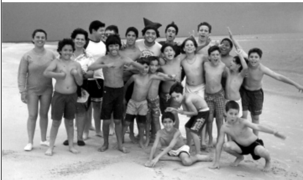
Niños argentinos participaron en un campamento de verano en Uruguay, organizado por el socio de la asociación argentina.