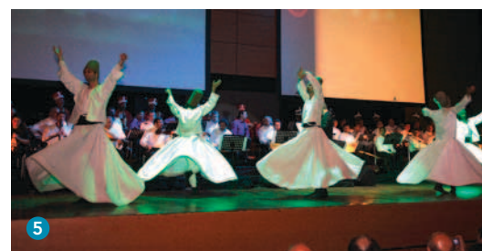
1. Kyoto, Japon, 1976 2. San José, Costa Rica, 1981 3. Milan, Italie, 1986 4. Madrid, Espagne, 1988 5. Istanbul, Turquie, 2008